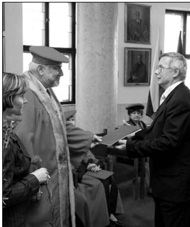
Docent Vatrál z FiF UK vychoval stovky novinárov. Ocenený bol okrem iného aj za iniciovanie vzniku elektronických magazínov, zabezpečenie rozhlasovej a televíznej techniky pre katedru či publikačnú činnosť.

deňa študentstva, tak to pre nás znamená veľmi veľa a uvedomíme si, že sú aj horšie dni. Ale pre dni, ako je tento, sa tu oplatí pôsobiť.