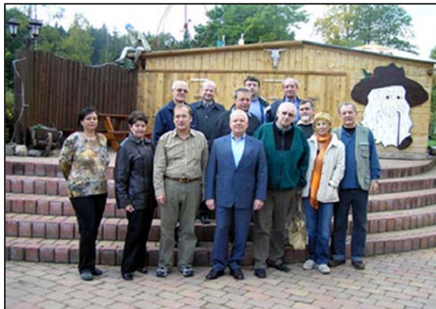
Dekani a prodekaní farmaceutických fakúlt diskutovali o bakalárskom štúdiu, prestupoch a výučbe športu a cudzích jazykov. Na snímke s generálnym riaditeľom Zentivy (dole v strede).