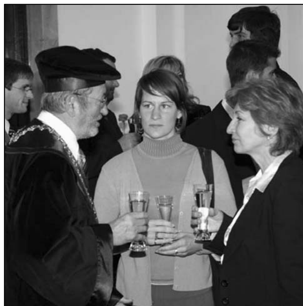
Záver stretnutia bol príležitosťou pre stretnutie študentov, ich rodičov a členov Vedenia UK.

Je to samozrejme pre mňa veľká pocta, najmä v mojom veku.