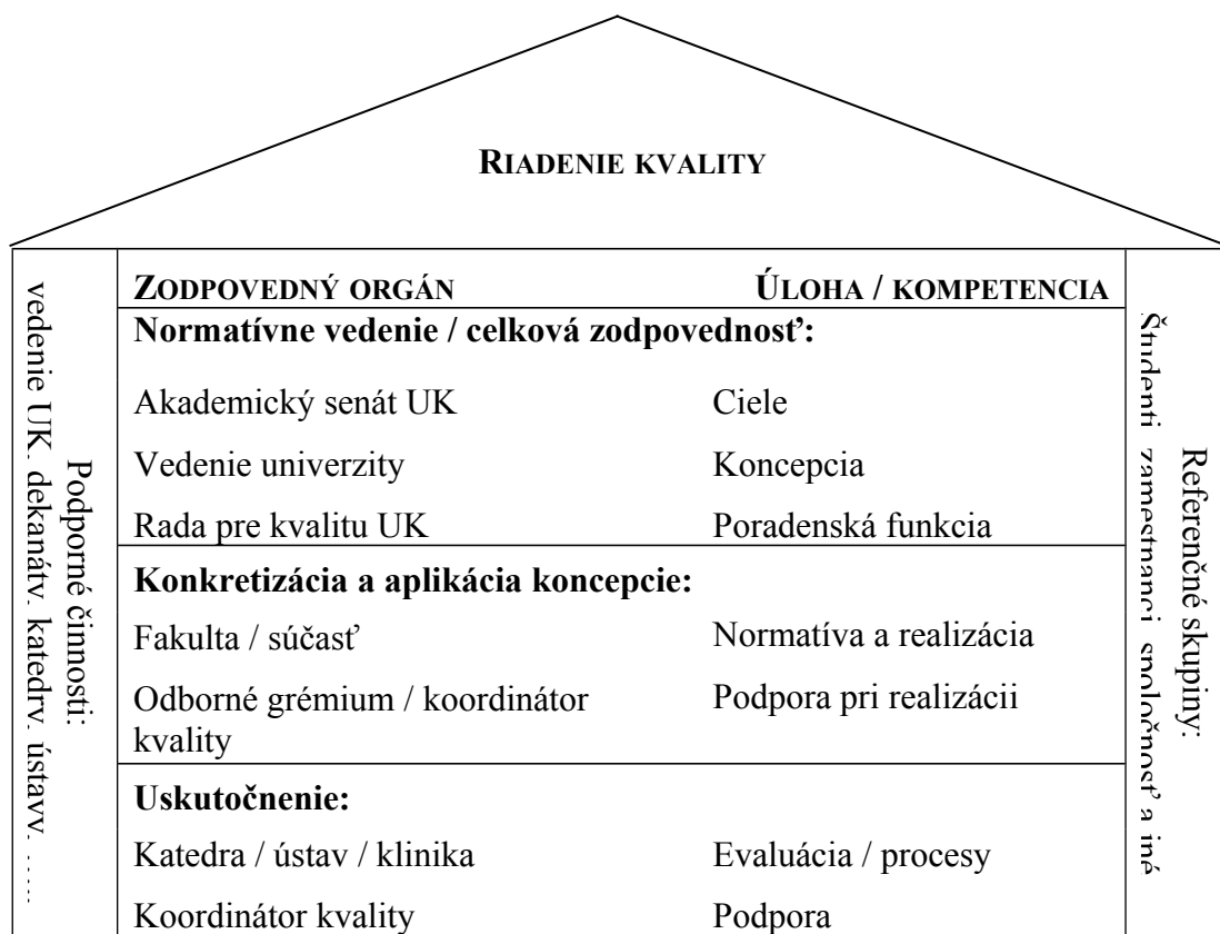
Obr. 2: Orgány, ich úlohy a kompetencie

Predsedom Rady pre kvalitu UK je prorektor pre rozvoj, členmi sú spravidla prorektor pre študijné veci, prorektor pre vedecko-výskumnú činnosť a doktorandské štúdium, kvestorka UK, ďalej zástupcovia fakúlt a súčastí UK, zástupcovia AS UK, zástupcovia študentov, prípadne aj ďalší (externí) experti z oblasti hodnotenia kvality. Rada pre kvalitu UK je poradným orgánom rektora v oblasti zabezpečovania kvality poskytovaného vysokoškolského vzdelávania v súlade s vysokoškolským zákonom. Vedecká rada UK prerokúva a schvaľuje príručky kvality v oblasti výskumu a vzdelávania, kolégium rektora prerokúva príručky kvality v oblasti manažmentu univerzity, tieto príručky schvaľuje rektor. Kvestorka UK, vedúci oddelení Rektorátu UK, dekáni fakúlt a tajomníci fakúlt sa, v spolupráci s koordinátormi pre kvalitu na fakultách, podieľajú na príprave príručiek pre oblasť manažmentu univerzity a prerokúvajú ich návrhy.